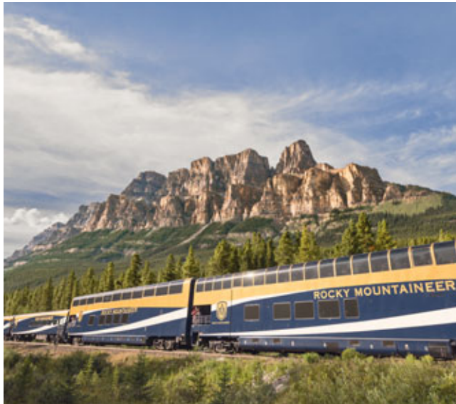
Der Luxuszug Rocky Mountaineer bietet den Reisenden erstklassigen Komfort.

So zählen diverse Konzerne aus dem Militärbereich, der Automationstechnik, der Zerspanungs- und Medizintechnik und auch Landesregierungen zum Kundenkreis.