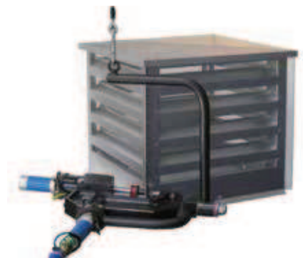
Chimenea de ventilación