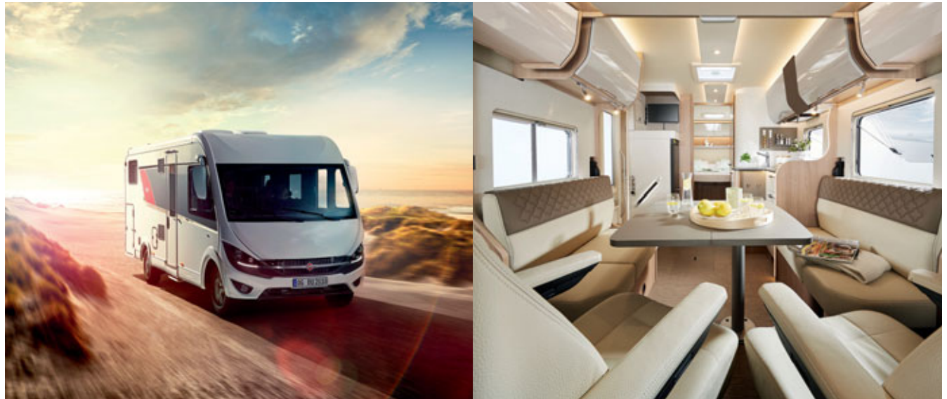
Der Ixeo I 736

Wohnmobile und Wohnwagen von Bürstner entstehen durch hohe Handwerkskunst in Verbindung mit industrieller Fertigung. Das Ergebnis sind individuelle Fahrzeuge, an denen ihre Besitzer jahrelang Freude haben. Flexible Grundrissarten, Oberflächendesigns und Bettvarianten ermöglichen dem Kunden, ein Fahrzeug nach eigenen Wünschen zu konfigurieren.